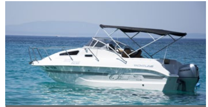
Sonnenschutzverdeck - praktischer Schattenspende

Erfragen Sie bitte unseren persönlichen Werbeträger-Rabatt