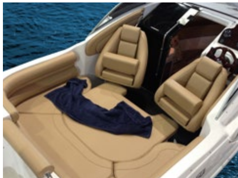
Spezial-Polsterpaket und Pilotensteuerstühle